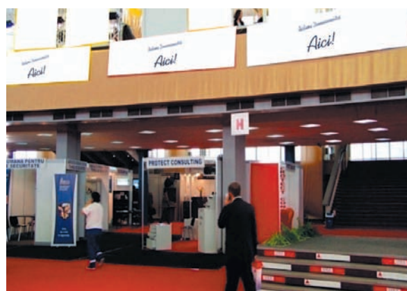
AFISARE BANNERE PAVILION A, FRIZA 4.50