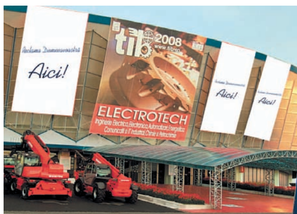
AFISARE BANNERE PE FATADA PAVILIONULUI A