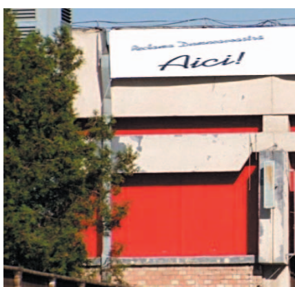
AFISARE BANNERE PE FATADA PAVILIONULUI C4