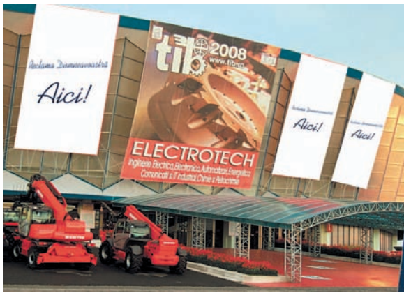
AFISARE BANNERE PE FATADA PAVILIONULUI A