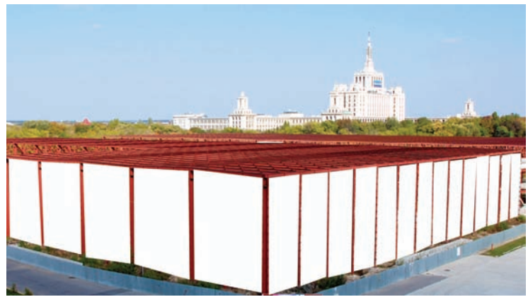
AFISARE BANNERE PAVILION B